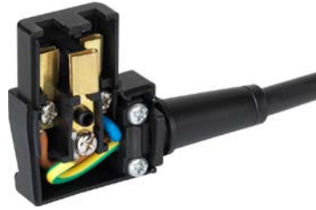
Beispiel mit angeschlossenem Kabel