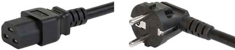
Netzstecker EU schwarz

EU Anschlussleitung mit IEC Gerätesteckdose C21, gerade