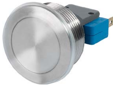
Der MSM-Taster ist nicht Bestandteil des Produkts

Siehe unten: Zulassungen und Konformitäten