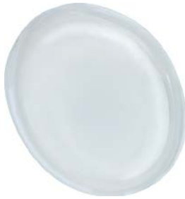
Schutzabdeckung für MSM 19 und MSM 22